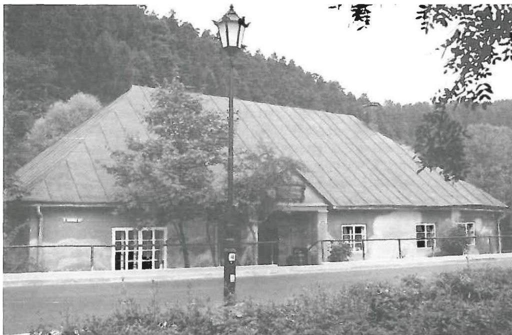
Muzeum Regionalne w Muszynie