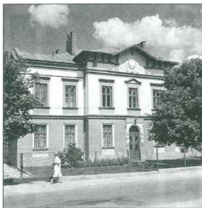
Sąd dzisiaj