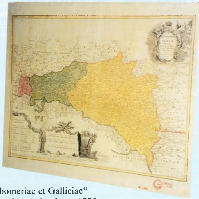
Mapa „Lubomeriae et Galliciae“ wykonana w Norymberdze w 1775 r. - miedzioryt kolorowany