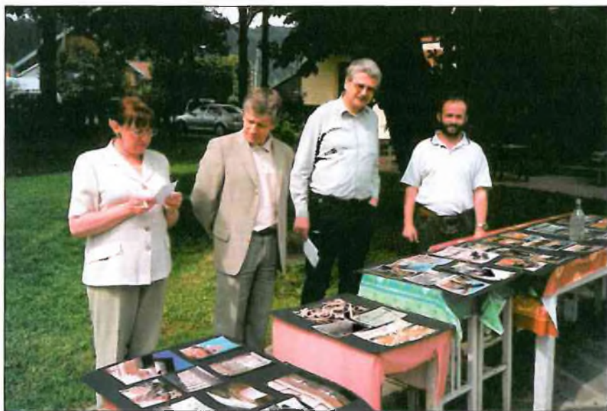
Jury pilnie zastanawia się nad werdyktem

Warto zaznaczyć, że prace zostały opatrzone godłami, a nazwiska ich autorów jury poznał dopiero po rozstrzygnięciu konkursu. Najciekawsze prace (nie wszystkie niestety się zmieściły i trzeba było dokonać bolesnej selekcji) zostały wyeksponowane w Pijalni Głównej w Krynicy, gdzie 3 lipca 2004 roku odbył się wernisaż, połączony z ogłoszeniem werdyktu jury.