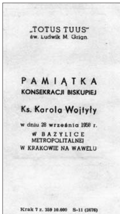
Jeden z eksponatów z „Kolekcji Papieskiej” – pamiętka konsekracji biskupiej ks. Karola Wojtyły (1958 r.)