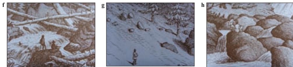
f. Na kamieniach nad potokiem w Dolinie Cichej w Tatrach 1851 r. Autolitografia z 1860 roku. ( Tatry w dwudziestu czterech obrazach , Kraków 1860, ryc. nr 62); g. Ze szkicownikiem pod pachą u podnóża skały Sowa w dolinie Kościeliskiej w Tatrach w 1851 roku. Autolit. z 1860 roku ( Tatry ... , Kraków 1860, ryc. nr 70); h. Na śliskim glazie pod „Wodospadem Zielonego Jeziora” w Tatrach w 1851 roku, w cylindrze oraz w surducie, w towarzystwie górala. Autolitografia z 1859 - 1860 r. ( Tatry ... , Kraków 1860, ryc. nr 34)