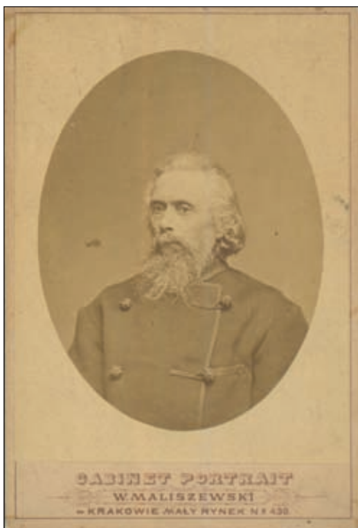
Portret fotograficzny M. B. Z. Stęczyńskiego, wykonany przez Walerego Maliszewskiego ok. 1880 r. w Krakowie. Ze zbiorów Biblioteki Jagiellońskiej w Krakowie, Oddz. Zbiorów Graficznych, sygnatura I.F. 2168 <22 II>

Trzecia fotografia przedstawia Stęczyńskiego znacznie starszego niż poprzednie. Jest to portret obejmujący tylko górną część tułowia. Jego twarz skierowana jest w prawą stronę, a siwe włosy na głowie zaczesane są do tyłu. Ma bujną, nieco zwichrzoną już siwą brodę. Ubrany jest w gruby płaszcz spięty ozdobnym guzem.