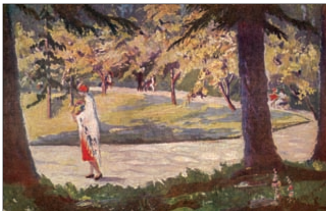
Krynica. Polana koło kaplicy. Mal. Stefania Jacyszynówna. Pocztówka z lat 20.