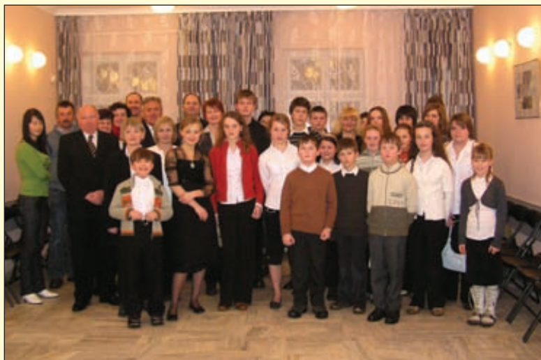
Fot. Łukasz Bajorek, Bożena Kruk