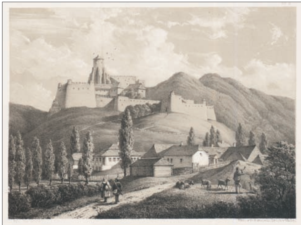
Príloha č. 6: Hrad Lubovňa a podhradie v polovici 19. storočia