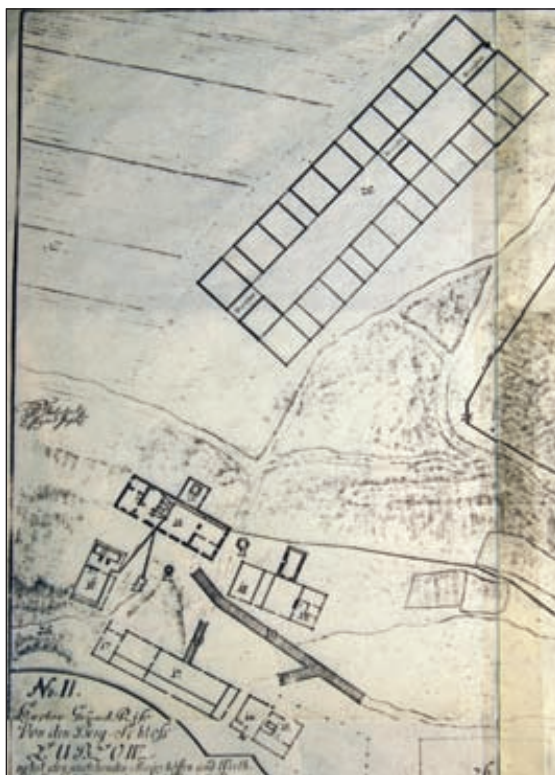
Príloha č. 5: Detail pôdorysu hospodárskych budov na juhozápadnom úpätí hradného kopca