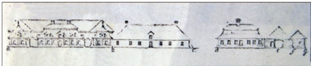
Príloha č. 3: Frontálny pohľad na administratívne budovy

Predná časť budov podhradia plnila funkciu administratívnych a ubytovacích objektov pre vyšších funkcionárov Spišského starostovstva. Podhradie však slúžilo i k inému účelu. Typickou funkciou hradov bolo zásobovanie hradného panstva a posádky. Pre splnenie tejto úlohy bol za prednou časťou celého komplexu umiestnený rozsiahly hospodársky dvor, zameraný predovšetkým na chov domestikovaných úžitkových zvierat s rozvinutým kanalizačným systémom.