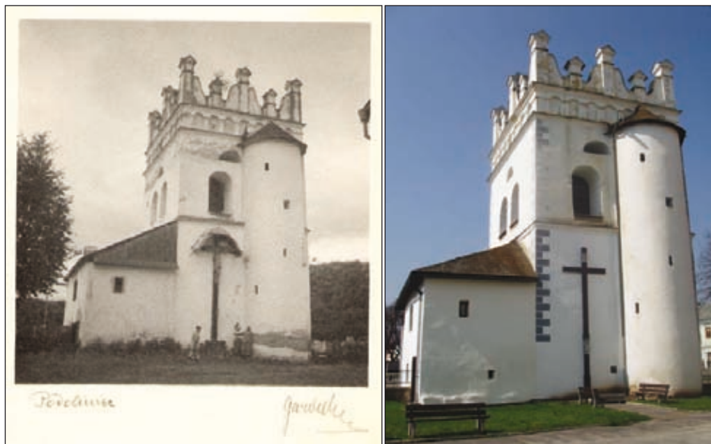
Obr. 9. Renesančná zvonica v Podolínci

a kostola piaristov (1651). Takto v pomerne krátkom čase, presnejšie v roku 1659, pribudla Podolíncu ďalšia významná, v tomto prípade neskororenesančná stavba 25 . Na fotografii neznámeho autora je na severnej strane zvonice umiestnený veľký drevený kríž s plastikou ukrižovaného Krista. Nad krížom sa nachádza (plechová?) strieška. V miestnosti vedľa zvonice (na obrázku vľavo) býval ešte v polovici 20. storočia strážnik, ktorý v noci strážil mesto 26 .