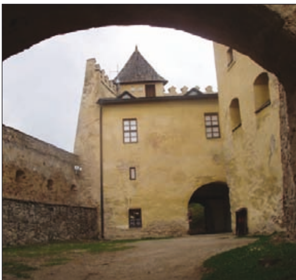
Obr. 3. Vstupný bastión z prvého nádvorja

Idąc od bramy w zamek jest po prawej ręce kortigarda (z franc. cordegarde), do której drzwi na zawiasach i hakach żelaznych i klamka do zamykania, piec nowy biały z kominkiem, ław przy ścianach trzy, stół jeden, okno jedno ... 12