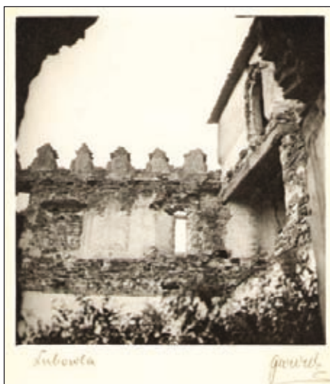
Obr. 2. Vnútro vstupného bastiónu

Na druhej strane sa v hornej časti ušnice nezachovali barokové kamenné ostenia okien(?). Tieto nie sú súčasťou ani hradného lapidária. Ušnica bola ešte v prvej polovici 20. storočia zastrešená viacbokým nepravidelným plochým ihlanom. Súčasná podoba strechy vyhotovená počas obnovy v 70. rokoch nezodpovedá žiadnemu historickému obdobiu berúc do úvahy časový úsek od výstavby vstupného bastiónu(!). V tejto súvislosti vzniká otázka, či bol zvolený správny prístup k obnove hradu. Ak sa napríklad na gotických, či renesančných objektoch v minulosti nachádzali barokové strechy, potom sa takáto možnosť ukazuje aj pri ich obnove. Inak je to však v prípade, ak sa na barokový objekt po obnove dá gotická strecha(!?). Povedané inými slovami: Ak by i staršie objekty Ľubovnianskeho hradu (napríklad gotické) mali barokové strechy, zodpovedalo by to určitému historickému obdobiu 11 . Nemožno však, podľa našej mienky, uplatňovať staršie typy striech, ako je samotný obnovovaný objekt.