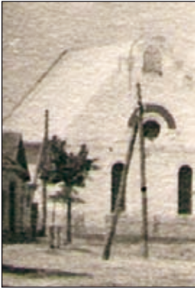
Obr. 7. Detail na synagógu v Podolínci

Na tomto zábere stojí ešte za pozornosť objekt v pozadí. Ide o synagógu, ktorá v súčasnosti už neexistuje. Vystavaná bola pravdepodobne v druhej polovici 19. storočia, okolo roku 1880 21 . Na zábere fotografa G dobre vidieť jej hlavné priečelie, orientované smerom na východ. Bola to pomerne jednoduchá stavba obdĺžnikového pôdorysu so sedlovou strechou. Vo vrchole hlavného štítu sa nachádzali tabuľky Desatora, čo patrí k charakteristickým znakom židovských modlitební. Stavba bola situovaná v smere východ – západ a stála za severnou líniou hradieb starého mesta. Pre lepšiu orientáciu situovania synagógy v zástavbe sídla uverejňujeme pohľadnicu z dvadsiatych rokov 20. storočia (výrazný objekt napravo od kláštora), vyhotovenú od severovýchodu (obr. č. 8) 22 .