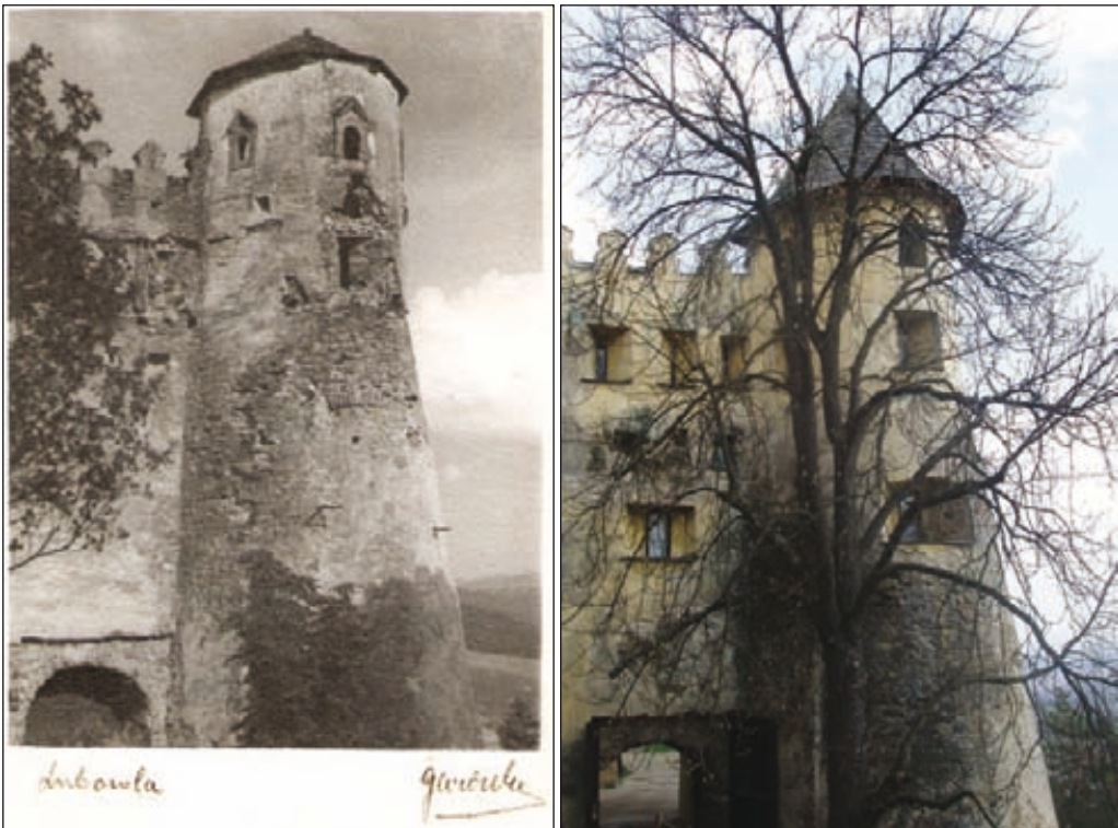
Obr. 1. Vstupný bastión so zaoblenou ušnicou

Od tej bromy idąc są sztachety aż do murowanej bromy, do której idąc bromy jest wzwód na walcu na czopach żelaznych, wrzeciędzów z skoblami dwa dla wzwodzenia. U tej bromy są wrota żelazne w drzewo opravne, u której są dwie kłódce z wrzeciędzami i z skoblami żelaznymi dwiema i kun żelaznych dwie do kładania drąga, a przy drągu trzecia... 7