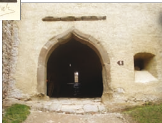
Obr. 4. Vstupná brána do horného hradu