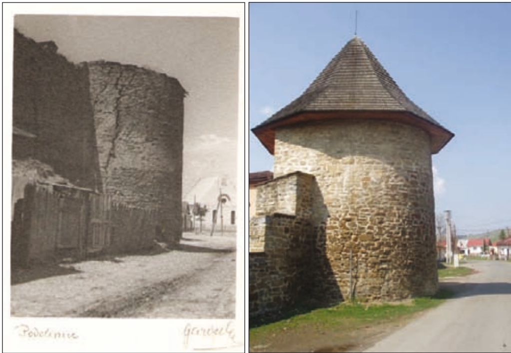
Obr. 5. Polvalcová bašta opevnenia v Podolínci

Prvé vráta, ktoré boli súčasťou pôvodne neskorogotického portálu, renesančne upraveného v 16. storočí (na zábere fotografa G vpredu), boli obité železom. Druhé vráta, ktoré tvorili súčasť renesančného portálu (na zábere fotografa G vzadu), boli drevené a dobre zabezpečené. Veľká klenutá brána s dvoma vrátami (portálmi) mala dĺžku 17,6 m a šírku 7,18 m. Pod touto bránou sa nachádzala pivnica, do ktorej sa privádzala drevenými rúrami voda. V bráne boli štyri strielne, ktoré sa zachovali do súčasnosti. Jednu z nich v neskoršom období rozšírili, zmenili na bránu a aj v súčasnosti sa ňou prechádza z podbránia na tretie nádvorie. Nad klenutou bránou sa nachádzalo niekoľko miestností, nad nimi ešte podkrovie, odkiaľ bolo možné viesť strelbu 14 . Počas obnovy hradu, na začiatku deväťdesiatych rokov minulého storočia, sa ukončila rekonštrukcia objektu brány do horného hradu, v ktorom sa v súčasnosti nachádza výstavná sieň.