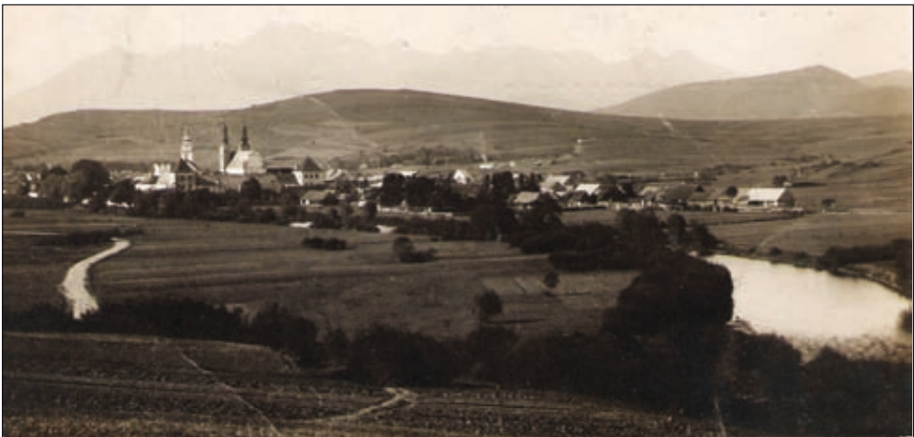
Obr. 8. Pohľadnica Podolínci z dvadsiatych rokov 20. storočia

Na tomto zábere stojí ešte za pozornosť objekt v pozadí. Ide o synagógu, ktorá v súčasnosti už neexistuje. Vystavaná bola pravdepodobne v druhej polovici 19. storočia, okolo roku 1880 21 . Na zábere fotografa G dobre vidieť jej hlavné priečelie, orientované smerom na východ. Bola to pomerne jednoduchá stavba obdĺžnikového pôdorysu so sedlovou strechou. Vo vrchole hlavného štítu sa nachádzali tabuľky Desatora, čo patrí k charakteristickým znakom židovských modlitební. Stavba bola situovaná v smere východ – západ a stála za severnou líniou hradieb starého mesta. Pre lepšiu orientáciu situovania synagógy v zástavbe sídla uverejňujeme pohľadnicu z dvadsiatych rokov 20. storočia (výrazný objekt napravo od kláštora), vyhotovenú od severovýchodu (obr. č. 8) 22 .