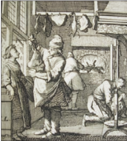
Vyobrazenie kuchára z roku 1628 12

kde bol po požiari roku 1553 postavený renesančný palác 5 , na ktorom pracovali staviteľa Antonio a Jacobo Italo , sliezsky architekt Joanni Frankstein i domáci Michael 6 . Na začiatku druhej polovice 17. storočia, keď bola v rokoch 1659–1664 vykonaná lustrácia Województwa Krakowskiego , sa kuchyňa v renesančnom paláci už nazýva „kuchnia wielka” 7 . Druhá kuchyňa bola podľa toho istého popisu situovaná v gotickom paláci pod sálou 8 , ktorý bol v prvej polovici 17. storočia za starostovania Lubomirských do značnej miery upravený 9 . V druhej polovici 18. storočia môžeme s presnosťou lokalizovať drevenú kuchyňu medzi kaplnkou a renesančným palácom 10 . V tomto období bol zrejme presun kuchyne z oboch palácov nutný, keďže stav oboch týchto stavieb bol značne narušený 11 .