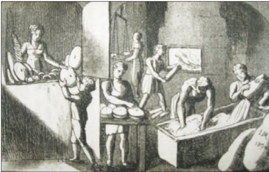
Vyobrazenie pekára z konca 18. storočia 31

Pekárstvo bolo nielen na hrade, ale všeobecne v spoločnosti uznávané remeslo, keďže „es uns mit dem nottwendigssten Beduerfnisse des Lebens: Mit Brot versorgt 25 “. Takto toto remeslo opisuje náučná kniha Gallerie der vorzüglichsten Künste und Handwerken für die Jugend mit theils in Kupfer gestochenen theils lithographischen Abbildungen derselben z konca 18. storočia, ktorá zachytávala všetky významné remeslá a umenie kresťanskej spoločnosti. Na Ľubovnianskom hrade bol preto pekár odmeňovaný nielen finančne, ale k svojej výplate dostal, podobne ako iní členovia osadenstva, aj súkno 26 . Pekári z hradu mali svoju pekáreň v 16. storočí v renesančnom paláci pod kuchyňou, resp. nad pivovarom 27 , pričom v 17. storočí pribudla ďalšia. Obe pekárne sa nachádzali v renesančnom paláci rovnako pod veľkou kuchyňou 28 . K výbave pekárne patrilo napríklad koryto, v ktorom sa pripravovalo cesto na chlieb 29 a pec „piekarniany“ 30 .