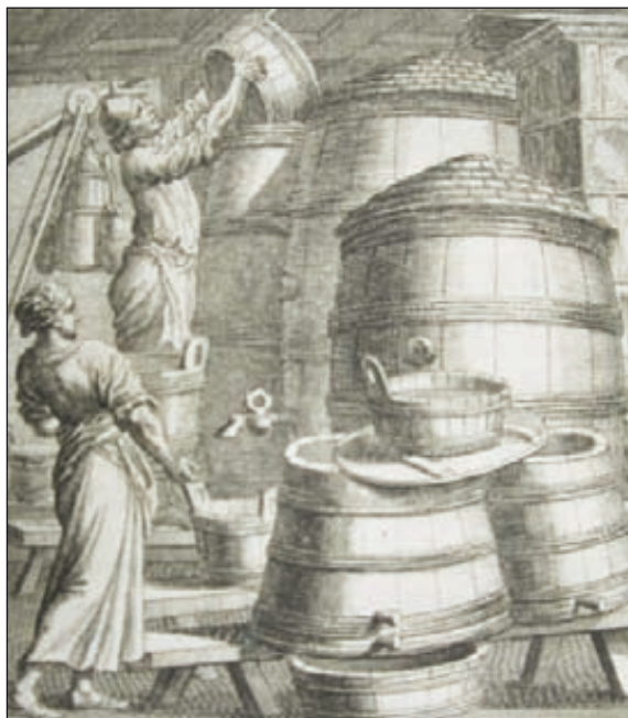
Vyobrazenie pivovaru z roku 1628 37