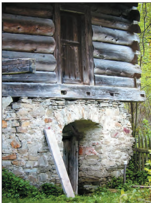
Roman Ślusarz – III nagroda